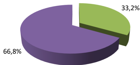
MARKET CAP | % EXPOSIÇÃO

■ Entre R$ 1 Bi e R$ 5 Bi ■ Entre R$ 5 Bi e R$ 10 Bi ■ Entre R$ 10 Bi e R$ 25 Bi ■ Acima de R$ 25 Bi